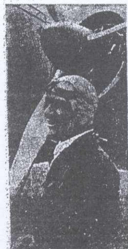
KOKKIYAKI, héroe del vuelo Moscu-Vladivostok, uno de sus más grandes pilotos del Ejército del Aire Soviético

de España las voces bronceadas de la guerra. Mañana, cuando amanecan de nuevo las de la paz, y el trabajo llene de fiebre todos los brazos, habrá que decir, recordándolo, como dijo Antonio Machado en su verso inmortar al despedir a Giner: '¡Unquez, canid; emudeced, campanas.'