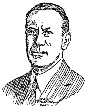
"El hombre de bien, para los seres de imperfecto desarrollo mental, es el que los halaga".