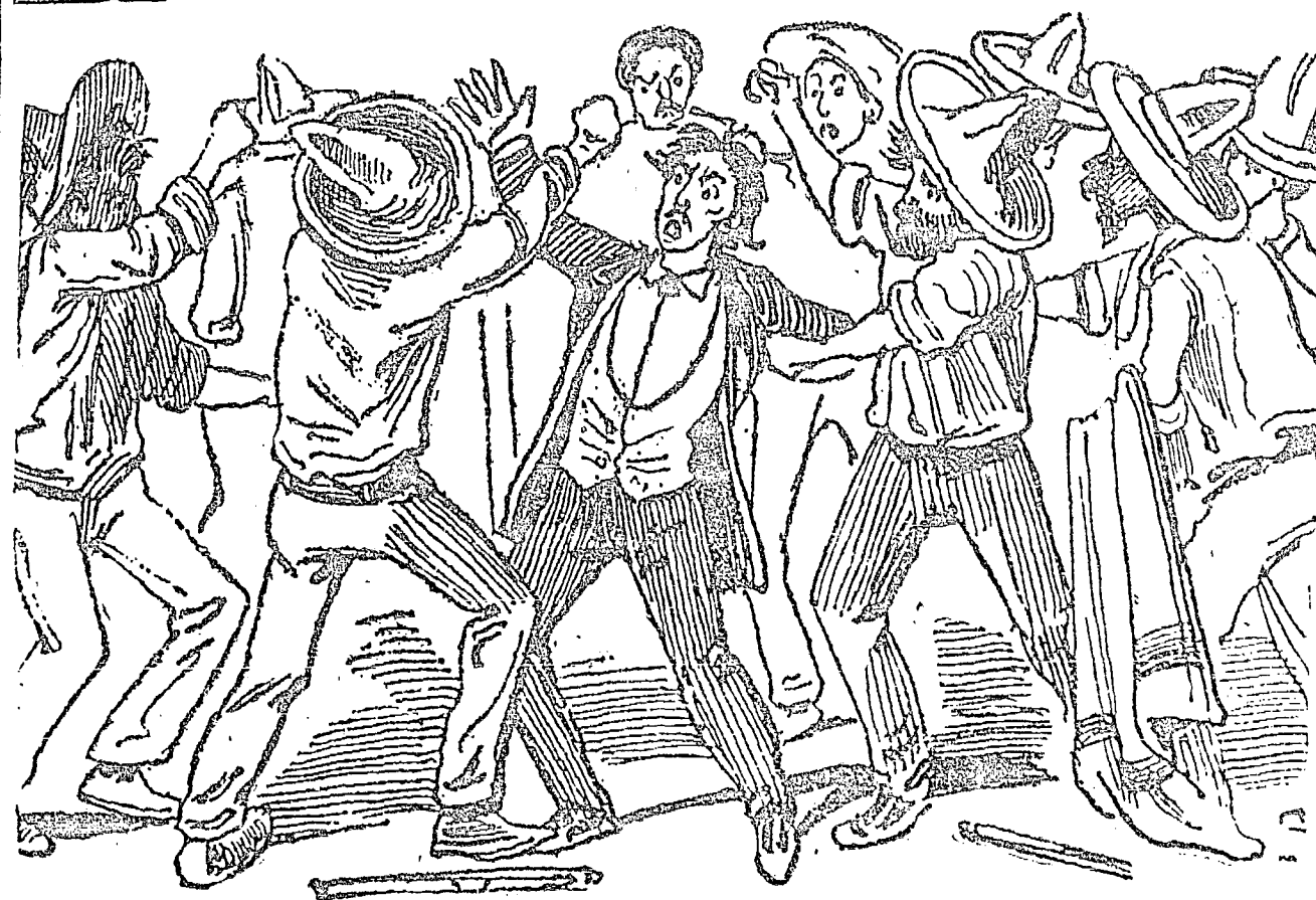
"En un salón en Tepic"