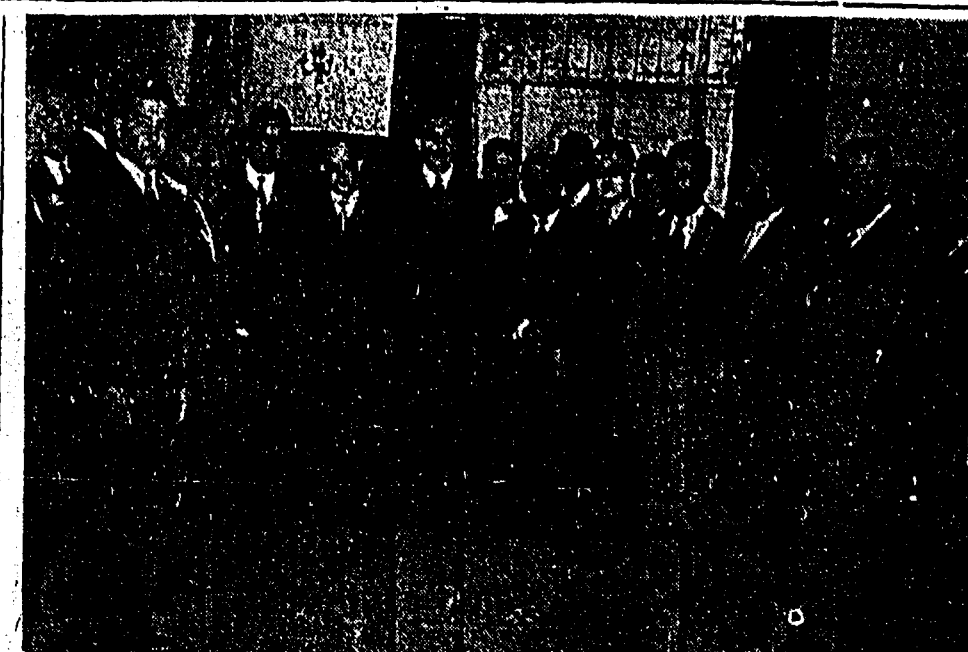
EL SEÑOR PRESIDENTE DE LA REPUBLICA con los diputados federales de los Estados de Zacatecas, Querétaro, San Luis Potosí, Veracruz, Yucatán, Durango y Tabasco, que estuvieron ayer a felicitarlo con motivo de la iniciación de su cuarto año de gobierno.