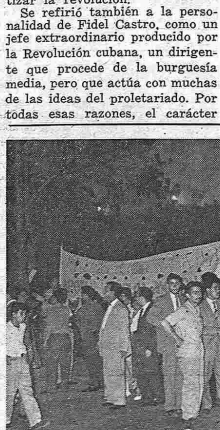
Otro aspecto de la manifestación de los españoles residentes en Caracas.

popular de la Revolución cubana es indiscutible.