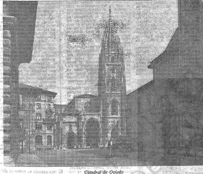
Catedral de Oviedo

"En todas las fuerzas de la oposición antifranquista del interior el punto de coincidencia de que es necesario llegar a la sustitución de la dictadura por una vía pacífica".