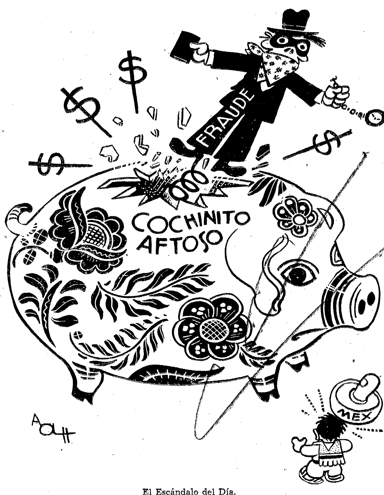
El Escándalo del Día.