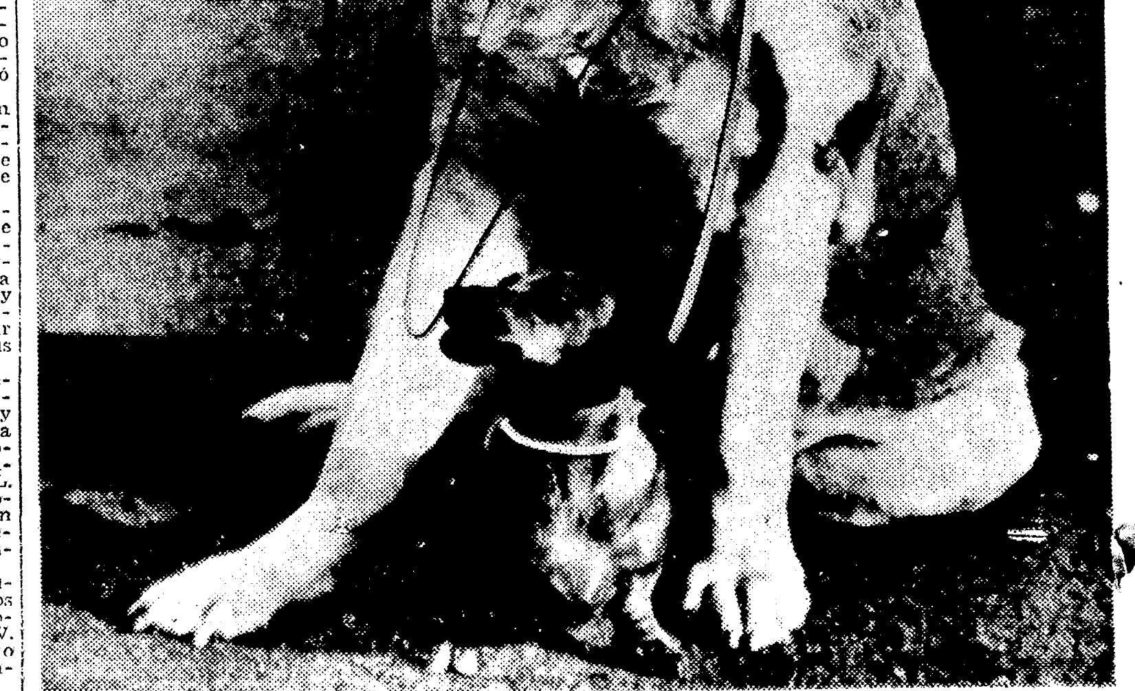
Para tener la seguridad de que nadie moleste a "Mitzi", verdadera miniatura entre los más pequeños perros de raza "Dachshund"...