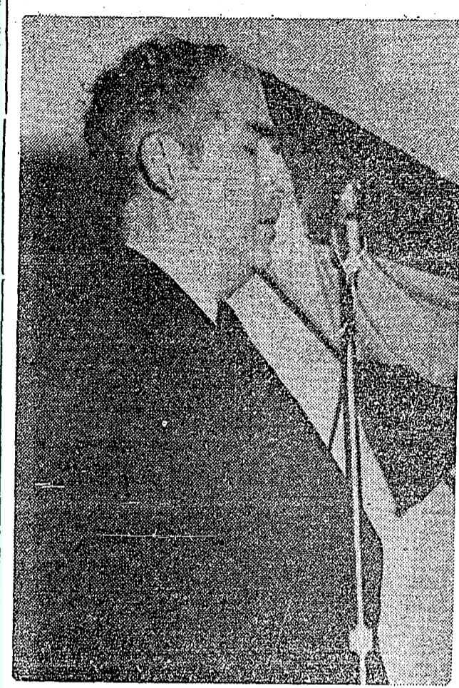
EL DOCTOR JUAN MARINELLO, prestigiado intelectual cubano, sustentó la noche del viernes, en el Centro Cultural Republicano Andaluz, de esta capital, una conferencia sobre el tema "Responsabilidad Americana en la Liberación de España". Al final de su trabajo, que fue muy aplaudido, los amigos españoles y mexicanos de Marinello le ofrecieron una cena en el mismo centro social. La foto muestra al conferenciante leyendo su obra.

Por último, el doctor Marinello agradeció las palabras dichas en su honor.