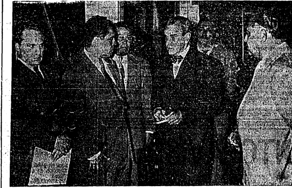
EL SECRETARIO DE GOBERNACION, señor Adolfo Ruiz Cortines en el momento de ser felicitado por un representante del Sindicato de Trabajadores de Gobernación, después de hacer entrega de las pólizas de seguros a las viudas de los empleados fallecidos recientemente