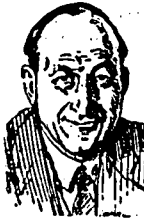
valla sino lo que daba de gocer al alma y de delicia a los sentidos.

Allá por el año veinte, yo estaba en Madrid. La incomparable Villa del