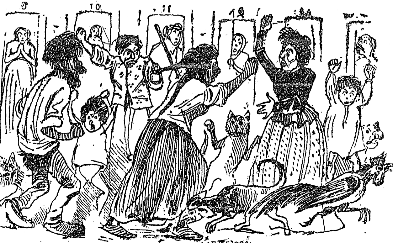
UN PLEITO DE VICINDAD