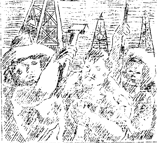
Y. ILL. - EL 18 DE MARZO DE 1938.

No quedaba otro recurso que someterse sin más apelaciones,